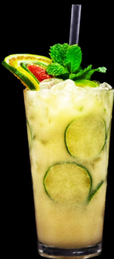
CAIPIRINHA LUCENA Vodka nacional com maracujá, abacaxi, limão e hortelã.

CAIPIRINHA DE RAPADURA 38,00 (Limão taiti e siciliano adoçada com rapadura)