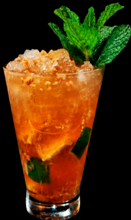
CAIPIRINHA DE RAPADURA Limão taiti e siciliano adoçada com rapadura.